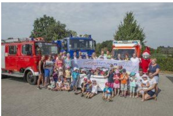
Offizielle Spendenübergabe der Volksbank Pinneberg-Elmshorn eG.

Seit 2016 lädt die Volksbank Pinneberg-Elmshorn eG Unternehmer der Region zum Grillen und Netzwerken ein. Das Event wurde zudem genutzt, um für einen guten Zweck zu werben. Im vergangenen Jahr wurden dabei von den etwa 400 teilnehmenden Unternehmen mehr als 25.000 Euro gestiftet. Die Bürgerstiftung Volksbank Pinneberg-Elmshorn stockte die Summe auf 27.500 Euro auf. Sie soll im gesamten Kreis zur Unfallverhütung eingesetzt werden.