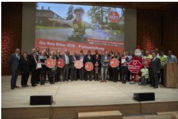
Gruppenbild nach der feierlichen Preisverleihung: alle Ausgezeichneten und die Veranstalter auf der Bühne.

Klar, wer in eine so tolle Location einlädt, der darf sich über den zahlreichen Zulauf nicht wundern. Dass aber auch die Qualität der Bewerbungen so hoch war, hat uns gefreut und die Jury ordentlich ins Schwitzen gebracht.