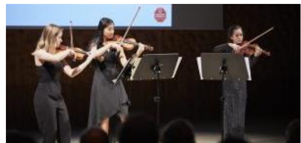
Sorgten zudem für einen festlichen Rahmen: ein Geigen-trio von The Young ClassX.

Weitere Informationen über die Preisträger und ihre Projekte finden Sie auf unserer Homepage.